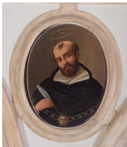
Santo Tomás de Aquino