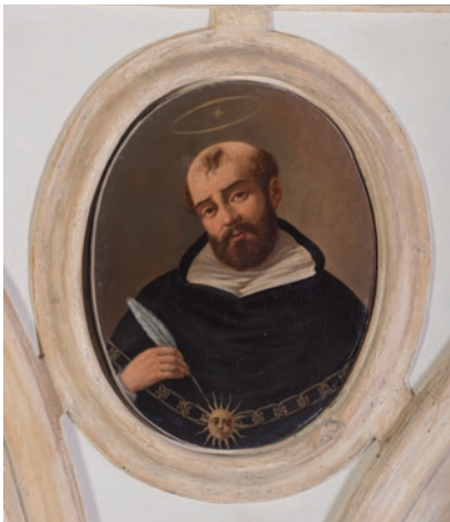
Santo Tomás de Aquino